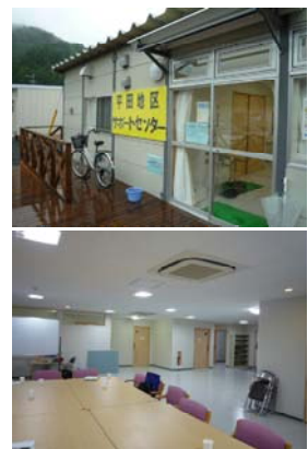
写真（上）サポートセンター外観、（下）集会室