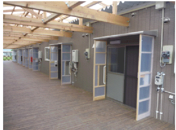
(右) ケアゾーンの仮設住宅