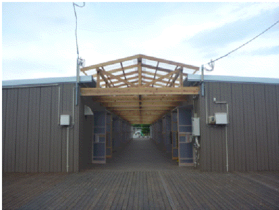
(左) ケアゾーンの仮設住宅 (正面)