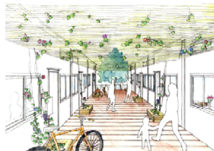
(上) ウッドデッキイメージ

などが配置される予定となっており、仮設住宅入居者の生活に資する機能を一体的に整備している。