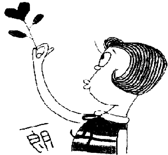
糖尿病予防活動モデル事業