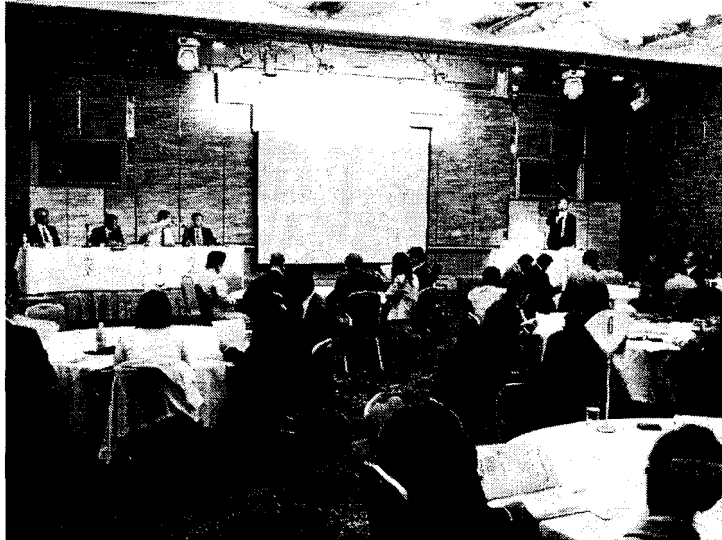
第13回障害者問題全国 交流会で滋賀の実践を 報告(06年10月)