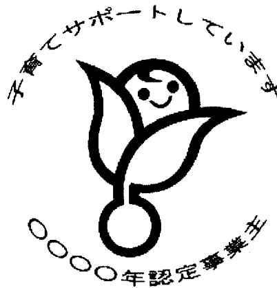
認定マーク「くるみん」

さらに、認定を受けた企業が使用できる「くるみんマーク」が住民の方々に周知されることにより、企業の更なる取組促進が期待できることから、「くるみんマーク」の住民等に対する周知についても、引き続き都道府県のご協力をお願いしたい。