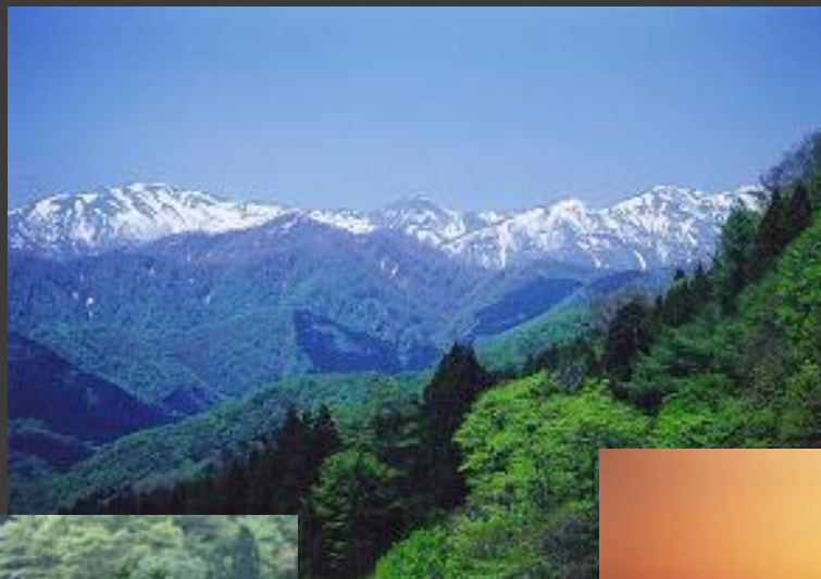
世界自然遺産白神山地