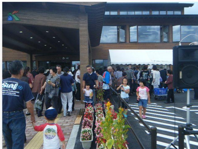
平成21年9月13日新庁舎オープン