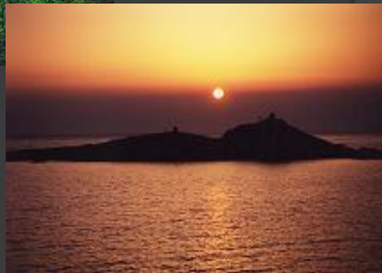
日本海 雄嶋に沈む夕陽