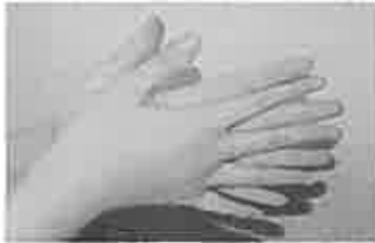
1. 手のひらを含ませ、よく洗う