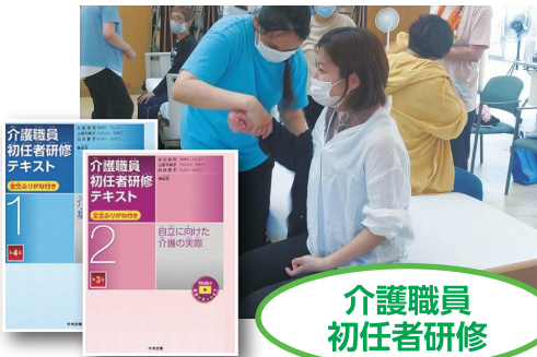
介護職員 初任者研修