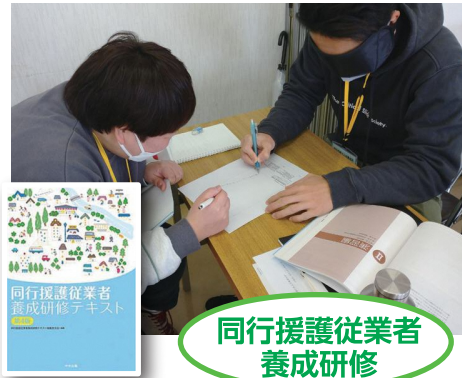
同行援護従業者 養成研修