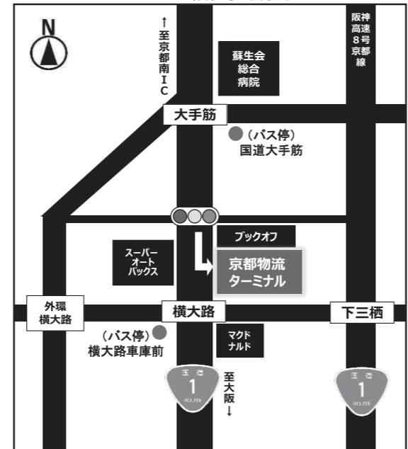
ヤマトマルチチャーター(株) 京都物流ターミナル 地図

※普通郵便は不可 ※手元にお控えが残る方法で送付してください。 ※上記の宛先でなければ、受付係まで届かない場合がありますので、ご注意ください。